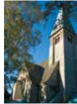
Katharinenkirche 11.15 Uhr, Provinzialstr. 410