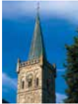
Bartholomäus-Kirche 10 Uhr, Theresenstr. 3

Wie bisher gibt es in der Regel nach allen Gottesdiensten Kirchkaffee; in der Katharinenkirche am 3. Sonntag im Monat als Kirchbrunch. Herzliche Einladung!